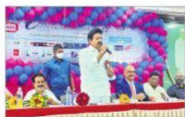
మాజుడుకుమ్మ ప్రభుత్వ విప్ సోమినేని ఉదయ భాను.